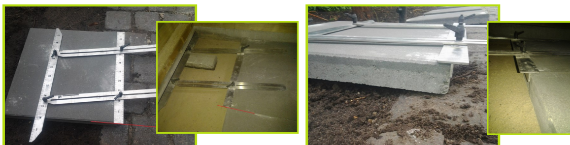
Aanlegpositie van de basisliniaal.

Stap 2: Links gemeten is links aanleggen.