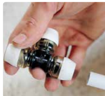
Perfekte installatieoplossing mogelijk bij moeilijk toegankelijke locaties