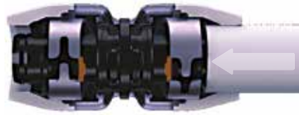
Leiding inschuiven tot aan klik