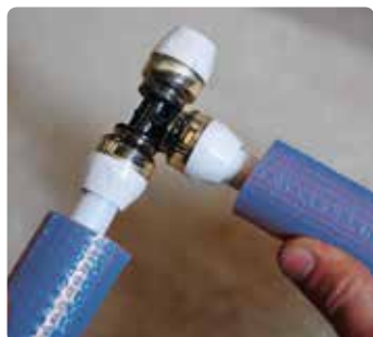
Snelle en eenvoudige montage.

Dezelfde kleurcodering geldt voor RTM en perstechnologie.