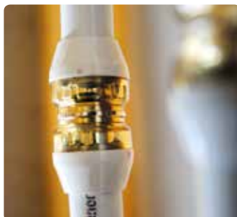
Optisch aantrekkelijke opbouwinstallatie.