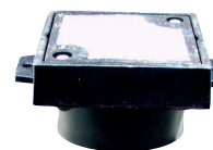
PE Monsternameput FKG B125/M125