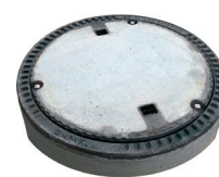
BEGU klasse B125 (stankdicht)